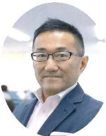
株式会社北海道宝島旅行社 代表取締役社長