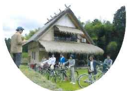
ニシオサプライズ株式会社 代表取締役

茅葺き物件の施行・修繕、不動産売買に加え、茅葺き民家一棟貸しの宿泊事業を展開し、茅葺き文化の普及・発展に努める。