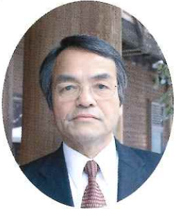
大会代表 南丹市美山エコツーリズム 推進協議会 会長